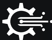
HIGH-TECH ZAŘÍZENÍ A ÚKOLY